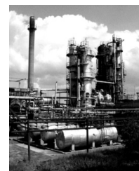
ПАПА САША РАБОТАЕТ НА ЗАВОДЕ