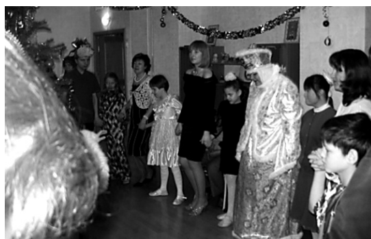
ДЕТИ ВСТАЛИ В ХОРОВОД