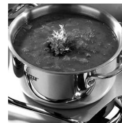
МАМА ЮЛЯ ВАРИТ СУП БОРЦ