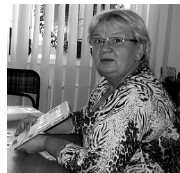
С ТЕТЕЙ РОЗОЙ