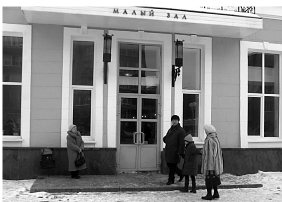
НАТА ИДЕТ НА КОНЦЕРТ