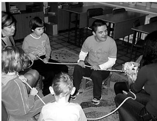
НАТА ЗАНИМАЕТСЯ В ГРУППЕ