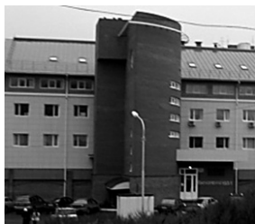
В ЦЕНТР ПСИХОЛОГИЧЕСКОЙ ПОМОЩИ