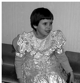
НАТА ЛЮБИТ ПРАЗДНИК