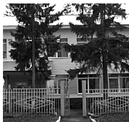
В ЦЕНТР РЕАБИЛИТАЦИИ